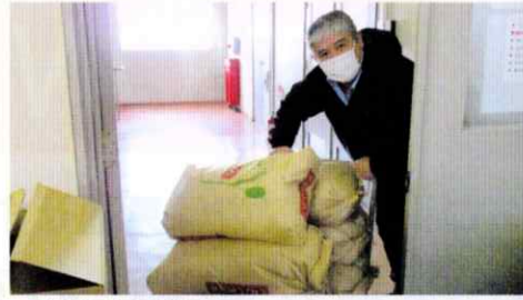
▲食品回収の様子(ご協力:日本たばこ産業株式会社さま)

★ここ2年の出荷量の急増に伴い、支援食料の箱詰めの際、「内容のバランス」を調整するための「食品購入費」が急増しています。